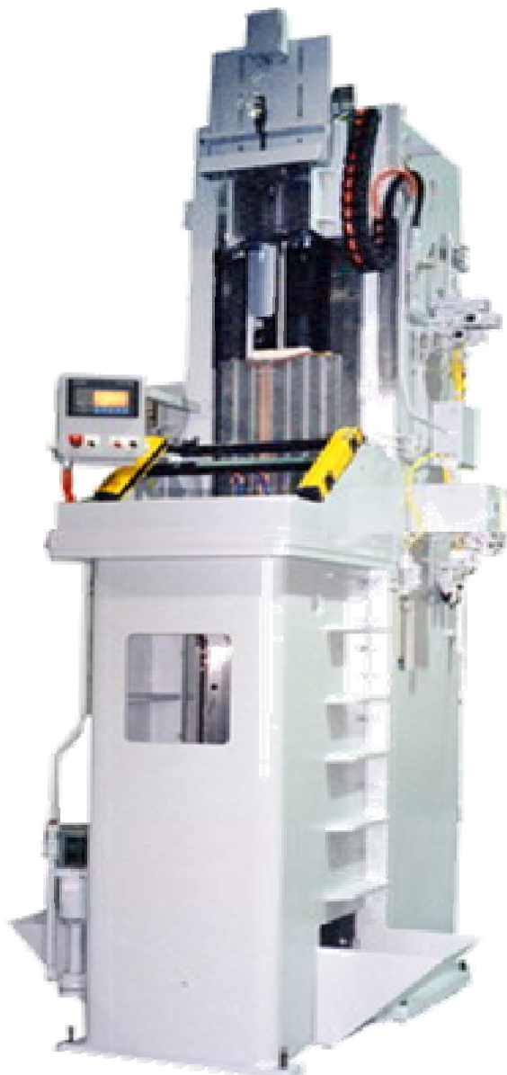
Модель VPD 35-72

Специализация для любого применения - От узкого до широкого - От одной до шести позиций