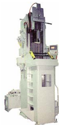
VPD 25 тонн 1828 мм ход

Сварные и цельнолитые чугунные компоненты