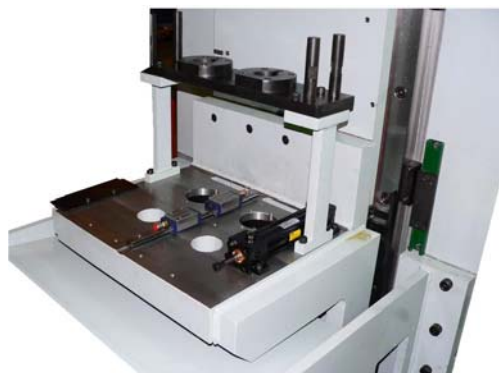
Одно или многопозиционные поднимающиеся столы

Протягивание деталей с жесткими допусками и высоким классом шероховатости поверхности возможно только на очень жестком оборудовании. Наша конструкция базируется на мощной цельной колонне и рабочим столом с основанием до самого пола, что делает станок чрезвычайно жестким. Массивные, закаленные и шлифованные, выставленные при помощи лазера направляющие и отштабренные опорные поверхности обеспечивают долгий срок службы и более плавное протягивание с высочайшей с точностью.